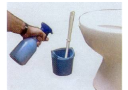
Application dans le réceptacle à brosse sanitaire, derrière le WC afin de détruire les mauvaises odeurs.

Compatible et recommandé pour les sanitaires, WC, urinoirs, raccordés sur les fosses septiques, les fosses toutes eaux ou sur le circuit de collecte d'effluents urbains. Produit biologique particulièrement actif pour l'hygiène les sanitaires et des surfaces souillées. Economique, son emploi régulier évite la formation des dépôts malodorants obstruant les évacuations ou siphons des toilettes. Combat efficacement et rapidement les mauvaises odeurs, odeurs putrides d'urine, de détritus, de moisi, de vomissures ou odeurs provenant de petits animaux domestiques en libérant une odeur fraîche agréable active pendant plusieurs heures dans la journée.