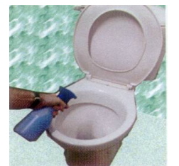
Application en pulvérisation directe dans les WC en début ou fin de journée.