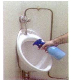
Application en spray dans les urinoirs et à proximité